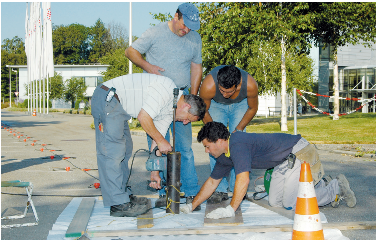
Erdbebenschutz als Daueraufgabe: geotechnische Bodenanalyse in einem Schweizer Kernkraftwerk.